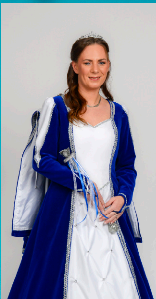
Sodener Tollität Prinzessin Monika die 78. auf Sodenias Thron